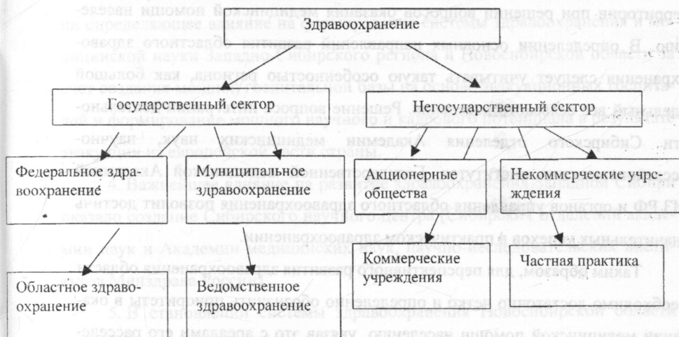
Рис. 2. Структура здравоохранения Новосибирской области 90-х годов

В заключении подводятся итоги исследования и кратко обобщаются материалы, изложенные в диссертации.